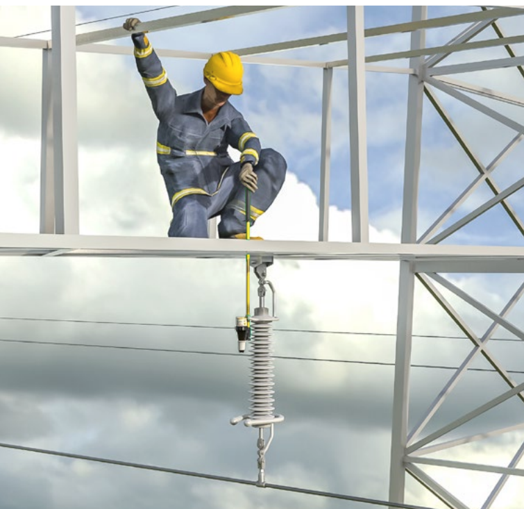
Der KP-Test 5D dual prüft hohe Spannung an Freileitungen in Bahn- und EVU-Bereich.

Mit unter einem Meter Gesamtlänge und einem Gewicht von 1.080 Gramm ist der KP-Test 5D dual in jeder Situation einfach zu handhaben. Egal ob im Einsatz auf dem Mast oder beim Transport in der ergonomischen Tasche mit Schultergurt. Damit bietet der Spannungsprüfer auch ein weiteres Plus an Sicherheit im täglichen Gebrauch.